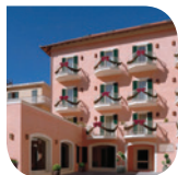
HOTEL TOSCANA**** Telefono: 0182/640657 info@hoteltoscanaalassio.it

CAMERA HOTEL 4 STELLE (colazione esclusa) - Camera singola € 130 - Camera doppia € 170