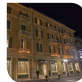
HOTEL DEI FIORI*** Telefono: 0182/640519 info@hoteldeifiori-alassio.it

CAMERA HOTEL 4 STELLE (colazione esclusa) - Camera singola € 130 - Camera doppia € 170