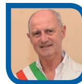
Enzo Canepa Sindaco di Alassio

Auguro a tutti i partecipanti una fruttuosa partecipazione ed un piacevole soggiorno con la certezza che la Città del Muretto non vi deluderà.