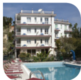
HOTEL GARDEN*** Telefono: 0182/470318 info@hotelgarden-alassio.it

CAMERA HOTEL 3 STELLE (colazione esclusa) Camera singola € 90 - Camera doppia € 130