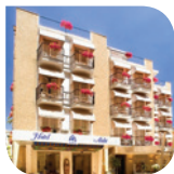
HOTEL AIDA*** Telefono: 0182/644085 info@hotelaida.it